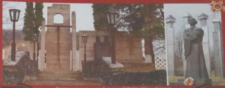
Памятник односельчанам погибшим в годы ВОВ 1941-1945 гг., с. Вережанин. Мемориальный комплекс жителей с. Ногини, погибшим в годы войны.