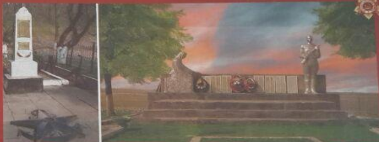
Памятник героическим защитникам Суражского уезда. Памятник односельчанам с. Каром, погибшим в годы ВОВ 1941-1945 гг.