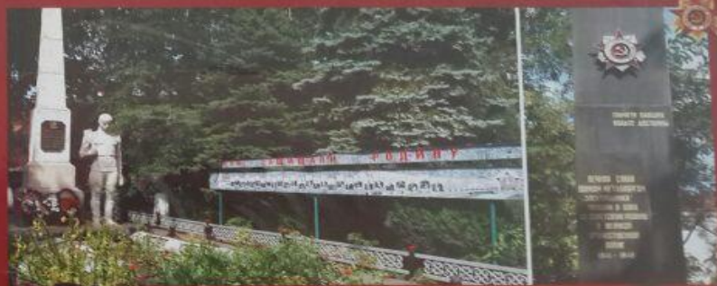
Вечная Слава воинам-морякам «Экстремориска», павшим в боях ВОВ 1941-1945 гг.